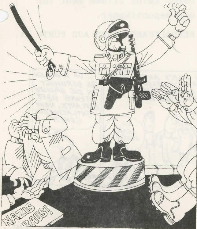
... die Polizei, die regelt den Verkehr!

Wer ist diese Partei, die zur Zeit in aller Munde ist, warum wird sie sogut von unserer Polizei bewacht ?